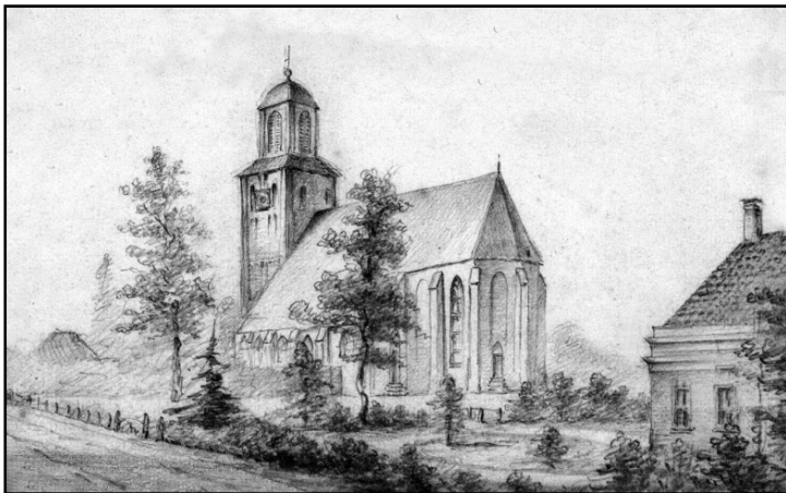
Kerk Beekbergen met lantaarnbekroning.