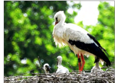
De ooievaarsnest bij Engeland heeft 3 kuikentjes voortgebracht.