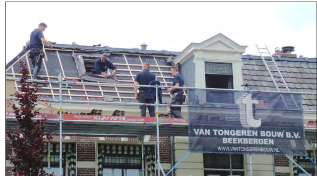
De werkzaamheden aan de pastorie zal ongeveer een maand duren.