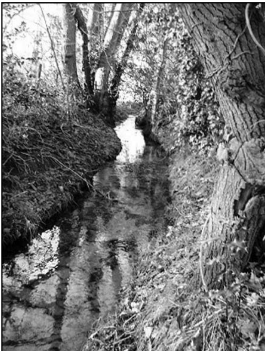
Oude beek of Beekberger beek.

De Veluwe werd tijdens deze ijstijd bedekt door een tientallen meters dikke ijslaag.